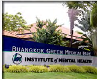
INSTITUTE of MENTAL HEALTH