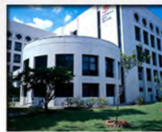
NATIONAL SKIN CENTRE