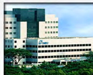
Singapore National Eye Centre