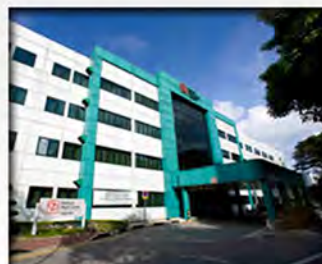
National Heart Centre Singapore SingHealth