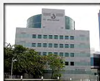
National Dental Centre Singapore SingHealth