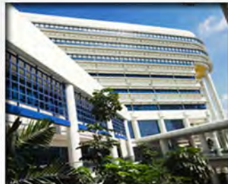
KK Women's and Children's Hospital SingHealth