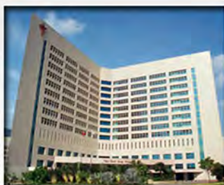
Tan Tock Seng HOSPITAL