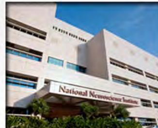
National Neuroscience Institute SingHealth