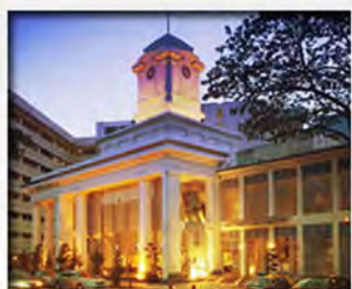
Singapore General Hospital SingHealth